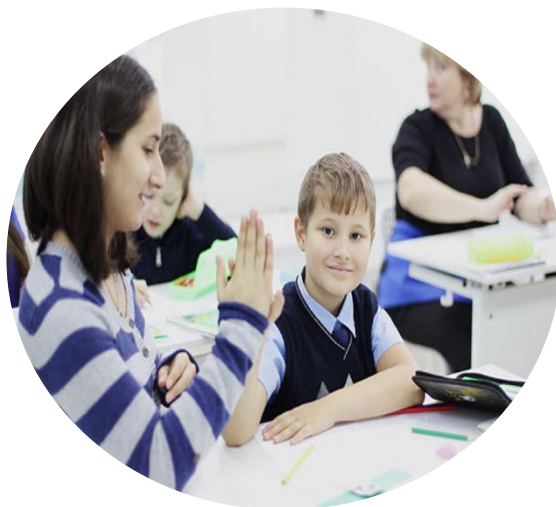
Особенности обучающегося с ЗПР