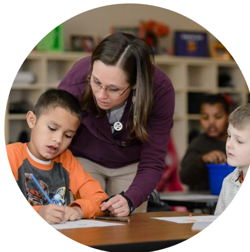
Особые образовательные потребности