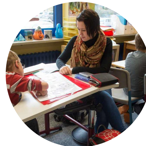
Специальные образовательные условия